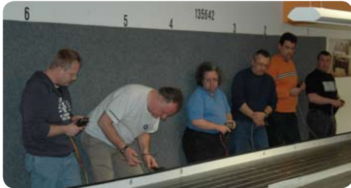
▲ Starter Gruppe 1 Klasse 2